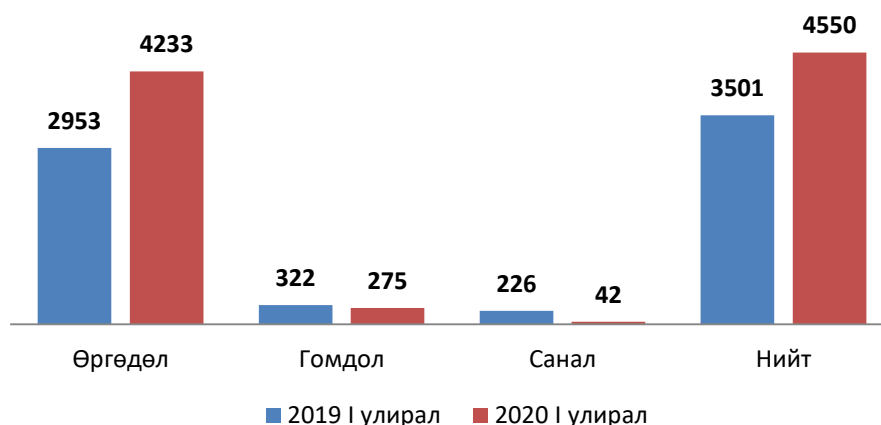
2019 оны I улиралтай харьцуулсан байдал

Өргөдөл, гомдлын мэдээг урд оны мөн үетэй харьцуулахад нийт өргөдөл, гомдол, саналын тоо 1049-өөр өссөн боловч гомдлын тоо 47-оор буурсан үзүүлэлттэй байна.